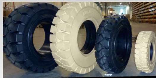
LLANTAS SOLIDAS O NEUMATICAS