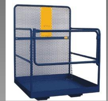
CANASTILLA O PLATAFORMA DE TRABAJO