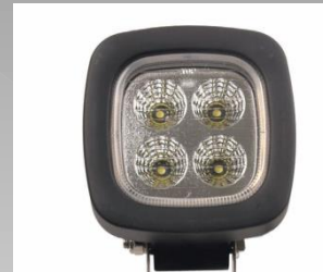
LUCES DE TRABAJO