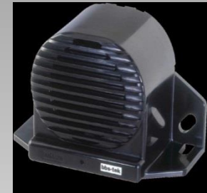
ALARMAS DE RETROCESO