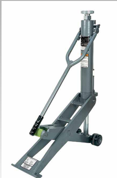
GATOS Y SOPORTES